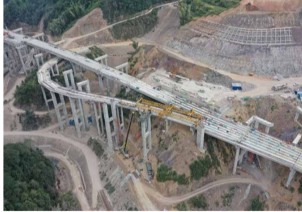
9月7日，官新三标C匝道桥60m曲线小半径梁板架设完成，属省内高速公路首次。