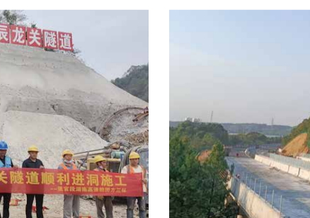
9月19日，城陵矶高速1标白竹坡大桥右幅边护栏浇筑完成，标志着项目桥梁工程全部完成。