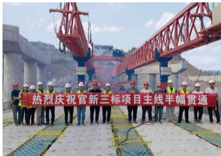
9月15日，官新三标实现主线半幅贯通，提前3个月完成业主下达的年度任务目标。