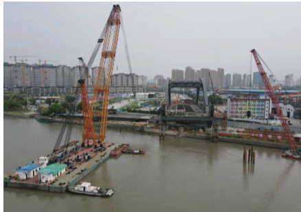
9月1日，溇湖大道(旺庄路-运河西路)工程LHU01标首片钢梁成功吊装。