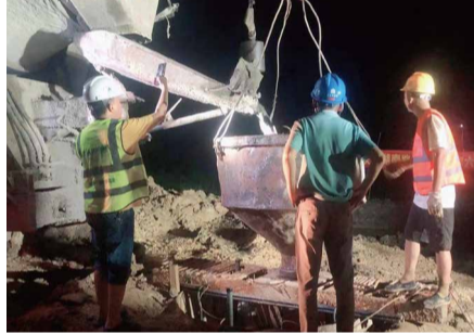
9月7日晚，益常扩容六标首根桩基浇筑完成，标志着项目正式进入主体工程实质性施工阶段。