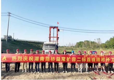
9月5日，益常扩容二标首根桩基(资水特大桥主桥右幅20#-2)顺利开工。