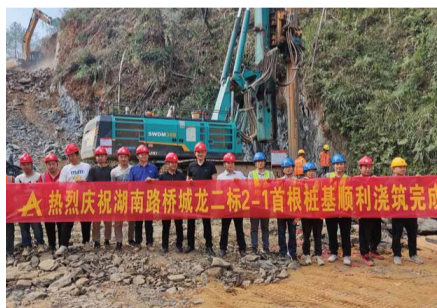
9月18日，城龙高速第2-1标首根桩基新屋里大桥右幅7a-1顺利灌注完成。