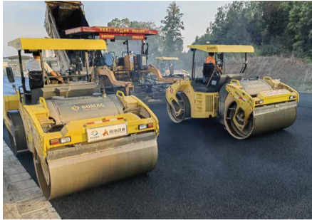
8月23日，宁韶二标沥青路面主线及互通匝道摊铺工作全部完成，再次领跑全线。

8月29日，永零三标项目党支部到晓埠塘村、竹洲村及毛家村开展金秋助学活动，为3名即将入学的大学生每人送上2000元助学金。(通泰公司 蔡子豪)