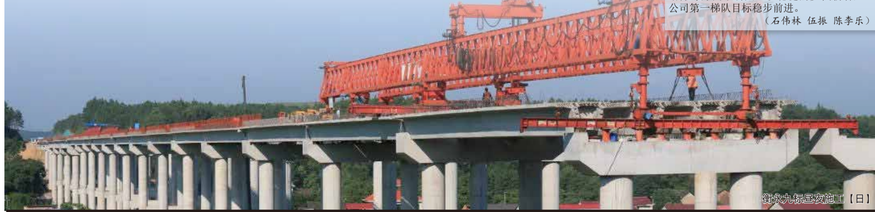
衡永九标昼夜施工（日）

为了激发人才活力，三分公司改革人才聘用机制，大力贯彻公平、公正、公开的选人用人原则，公司本部中层管理人员实行公开招聘，打造务实担当的高素质干部队伍。 在人员稳定的前提下，公司召开党委会研究细化各项改革创新措施，健全完善制度体系，共同推动建立按制度办事、靠制度管人、用制度规范行为的长效机制；依法依规细化“三重一大”事项清单和决策流程，围绕三大指标安排部署工作任务，并组织实施。 党委会坚持重大问题前置讨论，对于组建前原五分公司、原建筑分公司不同的业务资质，进行大胆整合资源和资产，主动整合资产和业务，构建以高速公路、市政版块、PPP项目开发业务为主，建筑版块、城镇建设等为辅的业务发展新态势，让主营业务并驾齐驱。 经过深入调研，三分公司制定了“一年打基础、两年见成效、三年上台阶”的行动规划和2022年“12345”总体工作思路。“1”就是咬定一个发展目标不动摇，力争进入集团主业公司第一梯队；“2”就是突出产值和效益两个核心；“3”就是守好质量、安全、廉政三条底线；“4”就是提供组织、制度、人才、资源四项保障；“5”就是强化业务拓展、快速建造、降本增效、人才培养、党建引领五项能力。