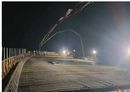
9月14日凌晨，靖黎一标项目全线现浇箱梁全部高质量完成浇筑。