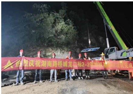
9月7日23点42分，城龙高速二标首根桩基顺利完成混凝土浇筑，标志着正式进入主体施工阶段。