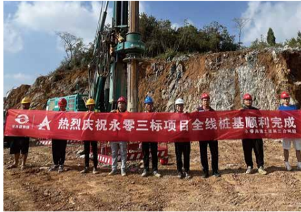
8月23日，永零三标蔡市互通A匝道跨线桥的最后一根桩基顺利完成浇筑，全线桩基工程全部完成。