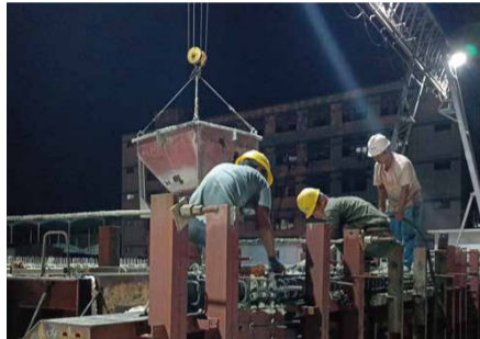
9月1日，浙江新昌项目T梁首件内河桥辅道桥1-2#顺利完成浇筑，标志着项目开启上部构造施工阶段。