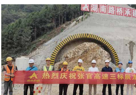
9月18日，张官3B标辰龙关隧道右洞正式进洞施工，标志着隧道进入实质性施工。