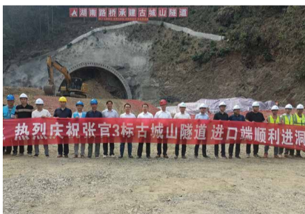
9月15日9点48分，张官高速3A标古城山特长隧道正式进洞，成为张官高速全线首个进洞的隧道工程。