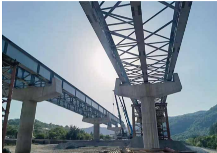
当地时间9月31日下午17时18分，格鲁吉亚E60项目全线最长的13号钢梁桥实现右线顺利架通。