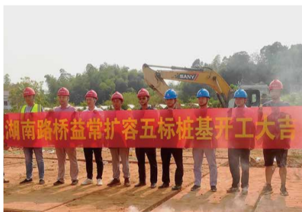
9月18日，益常扩容五标首根钻孔桩正式开钻，标志着项目正式进入主体施工阶段。